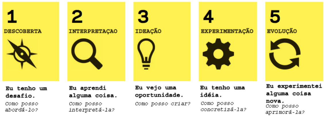
Figura 4: Modelo de Design Thinking para a educação