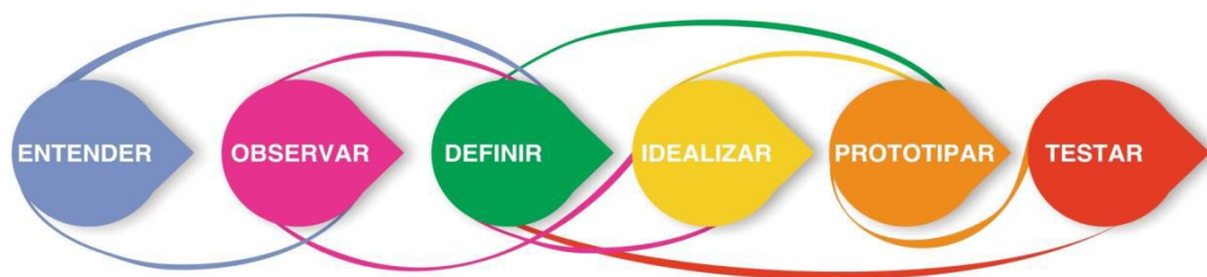
Figura 1 - Processo de Design Thinking segundo abordagem da D.school de Stanford

Na visão da d.school de Stanford (2011) apud Cavalcanti (2014), o design thinking é composto por seis etapas: entender, observar, definir, idealizar, prototipar e testar. O modelo é apresentado na Figura 01.