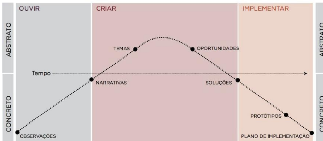
Figura 2 - Processo de Design Thinking segundo abordagem da IDEO